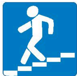
Знак 6.6. Подземный пешеходный переход