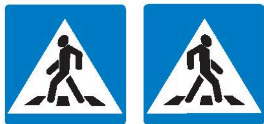
Знаки 5.19.1 и 5.19.2 Пешеходный переход

Если нет подземного или надземного пешеходного перехода, можно перейти по наземному пешеходному переходу